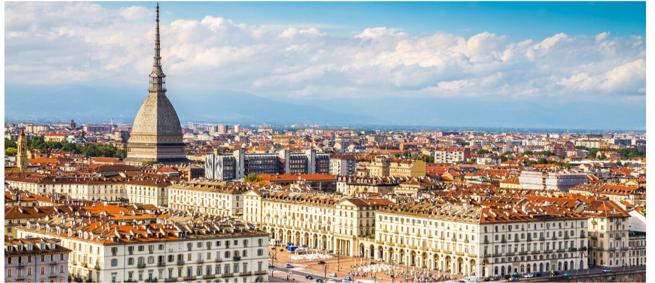
Die Mole Antonelliana, das Wahrzeichen von Turin (links im Bild).

Das Best Western Hotel Crimea*** liegt im schönen und ruhigen Wohnviertel Borgo Po. Die nahe gelegene Steinbrücke führt über den Po direkt ins Stadtzentrum. Die Unterkunft bietet komfortabel eingerichtete Zimmer und die üblichen Annehmlichkeiten eines gepflegten Stadthotels.