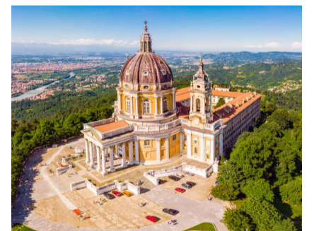
Der Wallfahrtsberg mit der Basilika Superga.

Nach dem Frühstück startet die Rückreise nach Aosta zum freien Mittagshalt. Mit wunderbaren, genussvollen Eindrücken reisen wir anschliessend via Grosse St. Bernhard zurück in den Oberaargau.