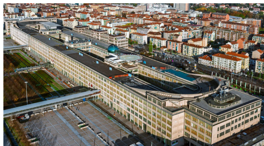
Die spektakuläre Teststrecke «La Pista 500».