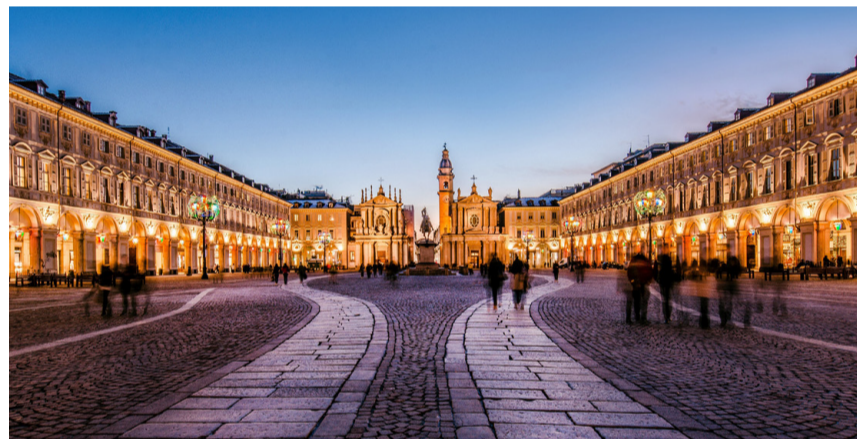
Die Piazza San Carlo im historischen Zentrum von Turin.