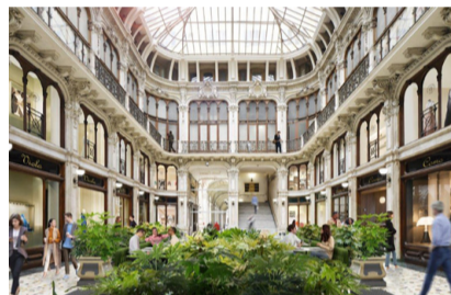
Die Galleria Subalpina.